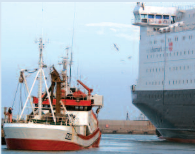
▲ Trawler og færge side om side. Spændvidden i Hanstholm Havn er stor og det skal den blive ved med at være. Såvel fiskeriet som havnen selv har rustet sig til fremtiden. Det har kostet – men investeringerne betaler sig, er man helt enige om.